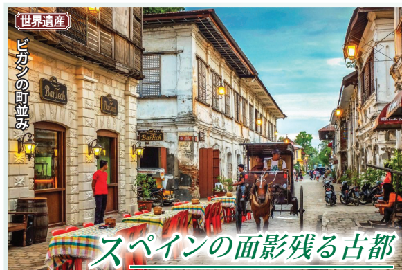
世界遺産 ビガンの町並み

ルソン島北部のコルディリエーラ山脈の急斜面に沿って階段状に開墾された棚田群。総面積2万ヘクタールで地球を半周するほどの長さには達するといわれています。まさに世界最大規模で、空へ聳えるように伸びるそのスケールの大きさを「天国への階段」と比喩されます。山岳民族のイフガオ族が、標高1,000mを超える斜面を人力だけで耕す昔ながらの米作りを2000年以上にわたって守り続けているのです。人間と自然が作り出した奇跡の絶景は、1995年に世界文化遺産に登録されました。