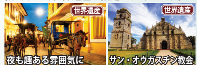
世界遺産 夜も趣ある雰囲気 世界遺産 サン・オウガスチン教会

大航海時代、スペインは世界中に植民都市を建設しました。ビガン、ラワグもそんな町のひとつです。世界遺産の町ビガンの中心は、石畳のクリソゴ通り。周辺には16世紀の石造りの家が並び、まるで中世のヨーロッパの雰囲気が溢れます。ラワグにもスペイン時代の町並みが残り、郊外のサン・オウガスチン教会は貴重なバロック様式の教会として世界遺産に指定されています。