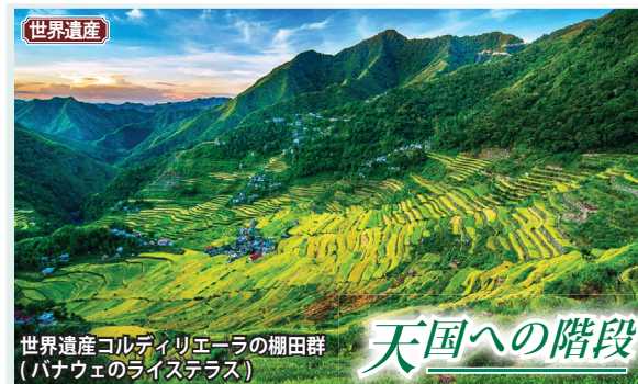
世界遺産 コルディリエーラの棚田群 (バナウェのライステラス)