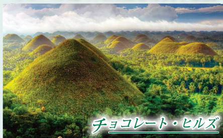
チョコレート・ヒルズ

高さ30～40mの円錐型の小山が、周囲一帯に延々と連なっていて、その数は約1,200個。未だにその形成過程は謎の摩訶不思議な光景をご覧ください。