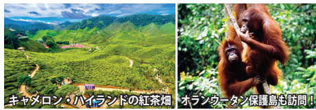
キャメロン・ハイランドの紅茶畑 オランウータン保護島も訪問！

15～17世紀の大航海時代、インド洋と南シナ海を結ぶ海上交易の要衝であったマレー半島。そのため、オランダやイギリスの影響が色濃く残る歴史の街々が残ります。また、それら欧州列強と中国の文化が混ざった独特のプラナカン文化が花開きました。今回、それら華麗な建築物、街並みを優雅に巡ります。クアラルンプールでは歴史あるクラシックホテルに2連泊。英国植民地時代の雰囲気をお楽しみ下さい。また、英国の紅茶ブレンディングで有名なキャメロン・ハイランドやオランウータン保護島など、その他のマレー半島の見所にもご案内します。