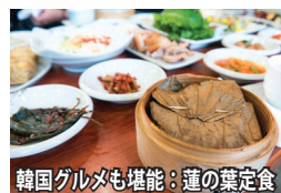
韓国グルメも堪能：蓮の葉定食