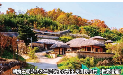
朝鮮王朝時代の生活文化が残る良洞民俗村 (世界遺産)

①新羅時代の仏教芸術の傑作・仏国寺と仏教芸術の最高傑作とされる釈迦如来が安置される石窟庵、②慶州歴史遺産地区、③海印寺の大蔵経板殿、④朝鮮時代の伝統家屋が残る良洞村、⑤扶余の百済歴史遺跡地区、⑥建築美と風景が調和し王朝時代を偲ばせる水原華城、⑦南漢山城、⑧朝鮮王朝時代の優美な姿を留める離宮建築と庭園が見事な昌徳宮、⑨朝鮮儒教の総本山・宗廟、⑩朝鮮王陵の王墓群