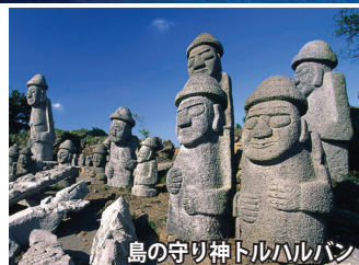
島の守り神トルハルバン