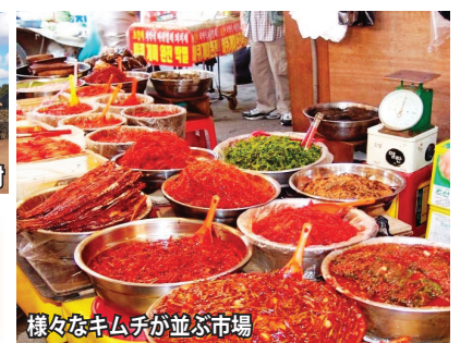
様々なキムチが並ぶ市場

朝鮮王朝時代の伝統家屋が残る良洞民俗村 (世界遺産) と済州島の伝統家屋群・城邑民俗村を訪問。また、郷土色豊かな韓国料理の数々もご堪能下さい。