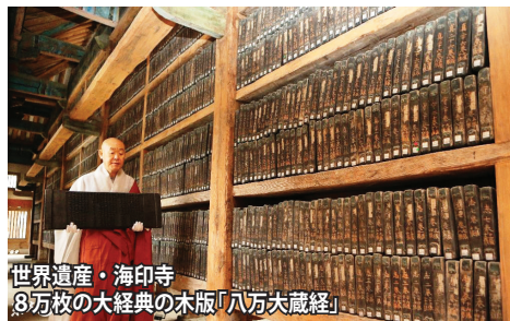
世界遺産・海印寺 8万枚の大経典の木版「八万大蔵經」