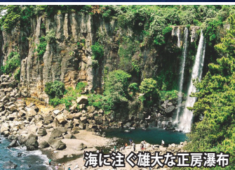
海に注ぐ雄大な正房瀑布