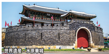
世界遺産・水原華城