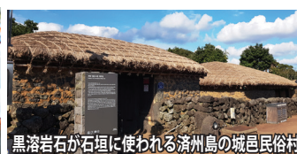
黒溶岩が石垣に使われる済州島の城邑民俗村