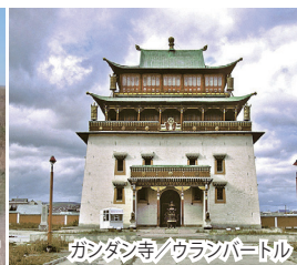
ガンダン寺/ウランバートル