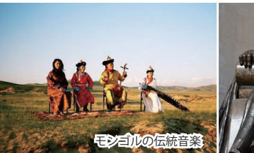
モンゴルの伝統音楽