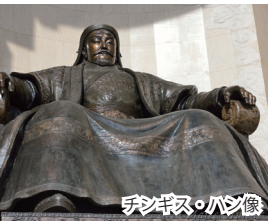
チンギス・ハーン像