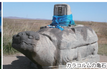
カラコルムの亀石