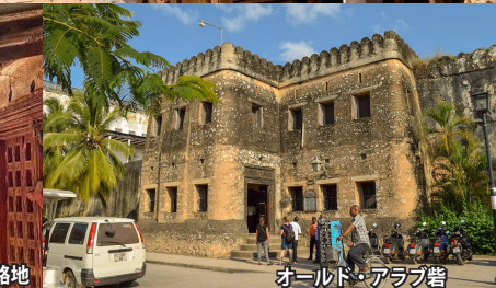
オールド・アラブ砦