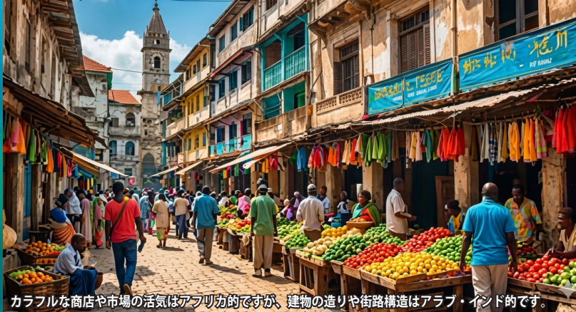
カラフルな商店や市場の活気はアフリカ的ですが、建物の造りや街路構造はアラブ・インド的です。