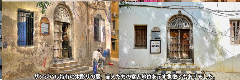
ザンジバル特有の木彫りの扉。商人たちの富と地位を示す象徴でもありました。