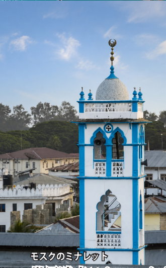
モスクのミナレット