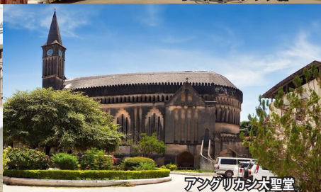
アングリカン式聖堂