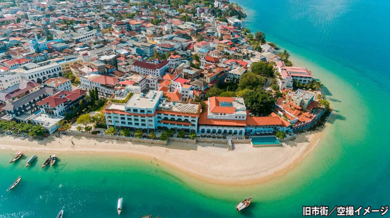
旧市街 / 空撮イメージ