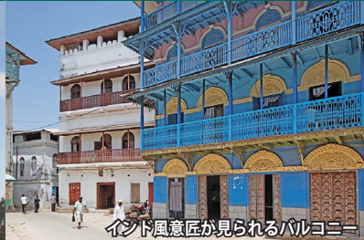
インド風意匠が見られるバルコニー