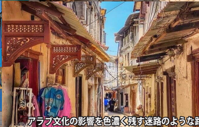
アラブ文化の影響を色濃く残す迷路のような路地