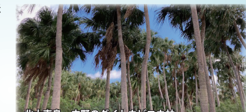
北大東島・中野のダイトウビロウ林

沖縄最東端の碑の下に広がる潮だまり「沖縄海」。視界の1100キロ先に小笠原諸島。