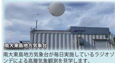
南大東島地方気象台

さとうきび運搬のため20世紀初頭から1983年に廃止されるまで稼働していた軽便鉄道