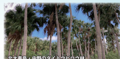
北大東島・中野のダイトウビロウ林

沖縄最東端の碑の下に広がる潮だまり「沖縄海」。視界の1100キロ先に小笠原諸島。