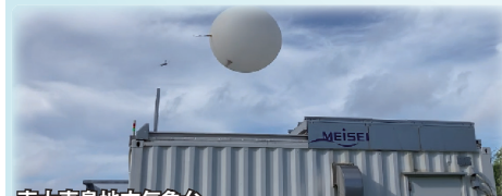
南大東島地方気象台

さとうきび運搬のため20世紀初頭から1983年に廃止されるまで稼働していた軽便鉄道