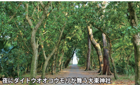
夜にダイトウオオコウモリが舞う大東神社

日暮れとともに大東神社の境内に飛び交う無数のダイトウオオコウモリをご覧いただけます。天候が良ければそのまま星空観察へ。