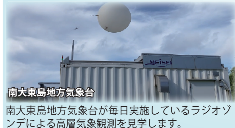
南大東島地方気象台

さとうきび運搬のため20世紀初頭から1983年に廃止されるまで稼働していた軽便鉄道