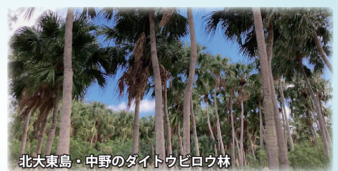
北大東島・中野のダイトウビロウ林

沖縄最東端の碑の下に広がる潮だまり「沖縄海」。視界の1100キロ先に小笠原諸島。