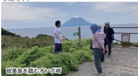
硫黄島を臨むオンボ崎

3島の中で一番鹿児島に近い竹島は、周囲9.7km、面積4.2平方kmと最小の島で、一番高い地点でも220mと平たい島。島一面が大名竹と呼ばれる竹で覆われたのどかな島です。