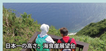
日本一の高さ、海食崖展望台