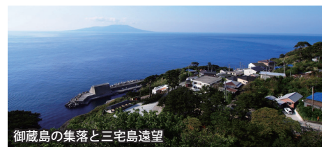
御蔵島の集落と三宅島遠望

■御蔵島の各宿泊施設は部屋数が少ないため、基本的に同性相部屋となりますが、今回は個室を確約いたします。 2名様(1部屋利用)で申込みの場合、それぞれ10000円割引いたします。