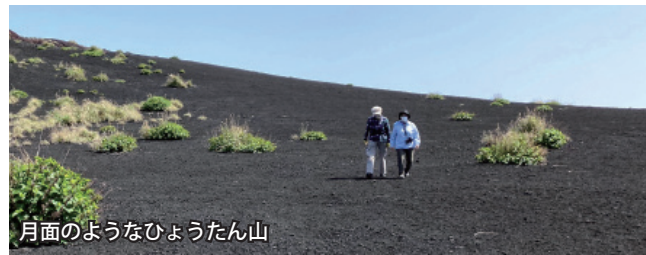
月面のようなひょうたん山

三宅島 本土から南に180km、山手線の内側と同じくらいの大さの島。有史以来の度重なる噴火でできた独特の自然景観を有し、アカコッコやカラスバトといった天然記念物もみれるバードウォッチング天国でもある、豊かな自然を存分に楽しめる島です。