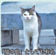
「猫の島」としても有名