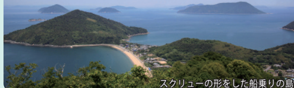
スクリーウの形をした船乗りの島

香川県西部・善通寺近くの須田港から定期船で約15分、塩飽諸島南部の島・粟島(あわしま)。3つの島が潮の流れでひとつになったことで特徴的なスクリーウ型をしています。1897(明治30)年、粟島に設立された日本初の海員養成学校は、現在、粟島海洋記念館となり、趣ある佇まいを残しています。