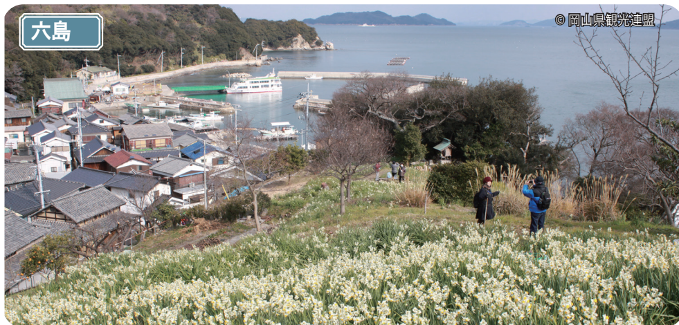
笠岡諸島の有人島の一つで岡山県の最南端の島。1月中旬から満開になる水仙で知られています。

※志々島の大楠と楠の倉展望台へは片道約30分程の上り坂を登ります。また、志々島以外の島々でも島内の移動手段が殆どないため、徒歩での観光となります。予めお含みおき下さいませよう、お願い申し上げます。