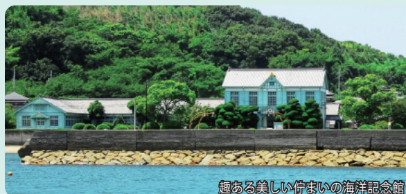
趣ある美しい佇まいの海洋記念館