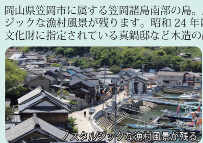
ノスタルジックな漁村風景が残る