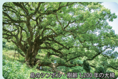
島のシンボル・樹齢1,200年の大楠