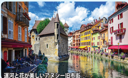
運河と花が美しいアヌシー旧市街