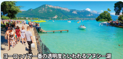
ヨーロッパで一番の透明度といわれるアヌシー湖

透明度の高い美しいアヌシー湖や運河沿いの旧市街が魅力で「サヴォアの宝石」と讃えられます。