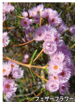
フェザーフラワー