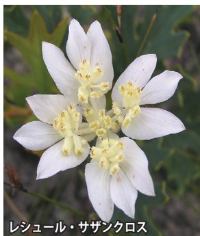
レシュール・サザンクロス