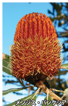
メンジス・パンクシア

西オーストラリア州はフラワーステートとも呼ばれ、世界で最も多い1万2千種以上のワイルドフラワーが自生しています。7月頃、北部から咲き始め、パース及びパース以北のワイルドフラワー・エリアでは9月過ぎに開花のピークを迎えます。今回、西オーストラリアの四大花街道を巡り、辺り一面がピンクや黄色、白に染まった圧巻の風景や、花の冠のようなリースフラワー、南十字星の形をしたサザンクロス、カンガルーの尾のような形をしたカンガルーポーなど特徴的な花を探します。各街道では花が咲いている場所で臨機応変に下車し、フラワーウォッチングをお楽しみいただきます。旅の最後は、州都パースに2連泊。西オーストラリア各地のワイルドフラワー約三千種が集められるキングスパークにご案内します。ツアーで出会った花の復習にもなるでしょう。