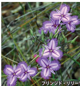
フリンジド・リリー