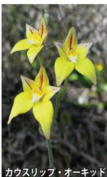
カウスリップ・オーキッド