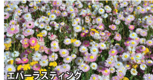
エバーラストディンダ