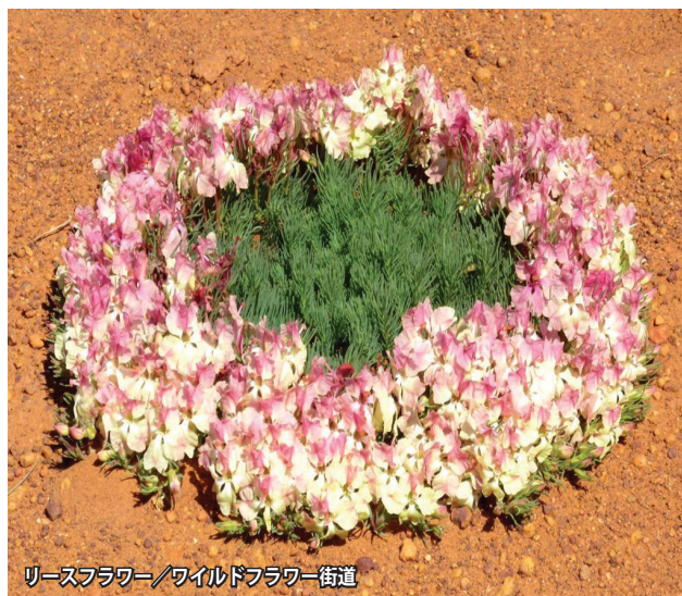
リースフラワー/ワイルドフラワー街道

キングスパーク 1895年に開園し、英国王が来園したことなどをきっかけに現在の名前となったキングスパーク。毎年9月は、西オーストラリア各地のワイルドフラワー約3千種が楽しめる花の楽園です。