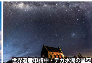
世界遺産申請中・テカポ湖の星空

テカポ湖 ミルキーブルーの湖面が美しいテカポ湖。光の当たり方で色の反射も変わるので、毎日湖の色が微妙に異なります。「善き羊飼いの教会」は、湖畔に佇む姿がとても美しく映えます。抜群の晴天率のため、夜は南十字星などが南の空にきらめきます。その星空を「世界自然遺産」に登録しようとテカポ湖では様々な試みが行われています。