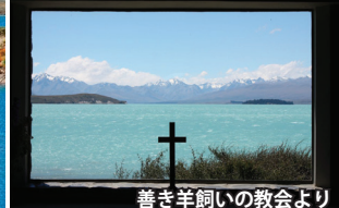
善き羊飼いの教会より