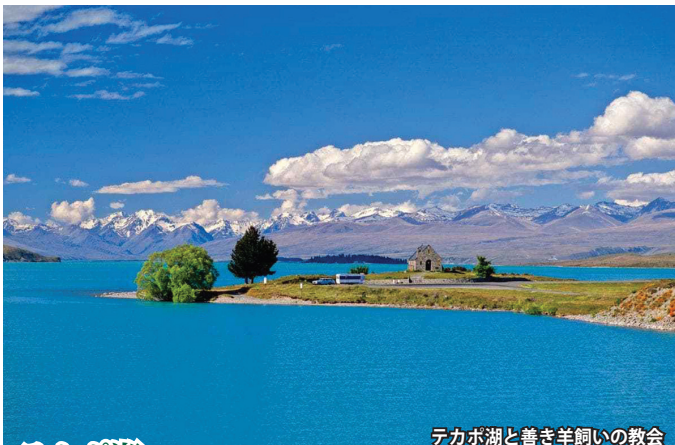
テカポ湖と善き羊飼いの教会

ロトルア 地熱活動が活発な北島。豪快な間欠泉や地熱地帯の他、先住民マオリ文化もご覧いただけます。