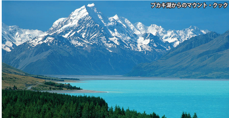
プカキ湖からのマウント・クック

ニューージーランド最高峰マウント・クック 標高約3,754mの国内最高峰マウント・クック。現地語ではアオラキと呼び、「雲を突き抜ける山」という意味です。この山を中心としたサザンアルプス山脈はまさに「南半球のアルプス」。プカキ湖からその美しい雄姿をご覧いただいたり、国立公園のハイキングなどをお楽しみいただけます。