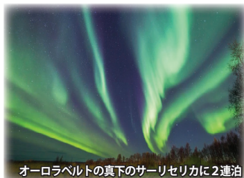
オーロラベルトの真下のサーリセリカに2連泊

※オーロラ、黄葉、野生動物などは自然現象のため、必ずご覧いただけるとは限らないこと、お含みお下さい。