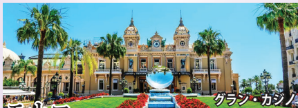
モナコ パチカンについて世界で2番目に小さな独立国。ハリウッド女優にして後にモナコ王妃となったグレース・ケリーで有名。