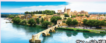
アヴィニョン 城壁に囲まれた世界遺産の町。かつてローマ法王庁が置かれていました。