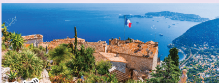
Èze 海拔420mの崖の上に位置する鷲の巣村。狭い路地と石造りの家々は中世の趣き。