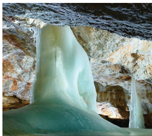
ドブシンスカ氷洞 世界遺産スロバキア・カルストの洞窟群のひとつ。氷の造形美をご堪能下さい。(※)

※3日目に訪れる洞窟は、現地事情により他の洞窟(オクチンスカ・アラゴナイト洞窟など)になる場合がございます。 ※悪天候により、ロムニツキー・シュティート峰のロープウェイが運休となる場合がございます。 ※羽田空港発着となる場合もございます。羽田発となった場合、空港使用料・保安サービス料は3,050円となります。