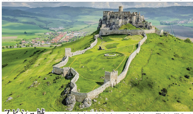
スピシュ城 1209年にタタール人(モンゴル人)の襲来に備えて建てられた城。次第に強大になったこの城は東スロバキアの重要拠点となり、城を中心に町は繁栄。しかし1780年の大火災で焼け落ち、現在は、廃墟となっています。1993年、世界遺産に登録。

イヤホンガイド・サービスを使用します。 昼食時、夕食時にドリンク・ウォーターをサービスします。