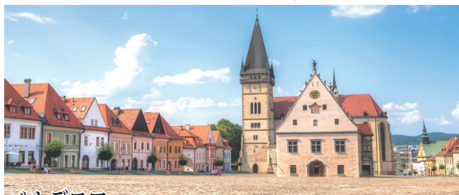
バルデヨフ ハンガリーとポーランドを結ぶ交易の要所として栄え、16世紀には最盛期を迎えます。小規模な町ながら保存状態が良い町として、2000年に世界遺産に登録。旧市街の中心ラドニツネー広場には、旧市庁舎と聖エギーディウス大聖堂が堂々と建ちます。