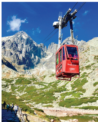
タトラ山地 ロープウェイにて標高2,634mのロムニツキー・シュティート峰の山頂展望台へ。