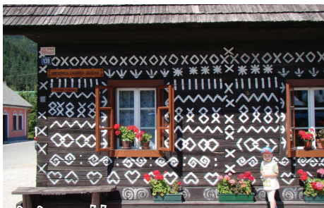
チチマニ村 壁に幾何学模様や花や鳥などの装飾が施されている木造の伝統民家が並ぶ村。