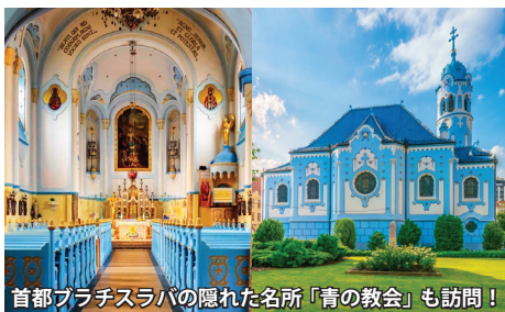
首都ブラチスラバの隠れた名所「青の教会」も訪問!

中欧の秘境スロバキアは、北海道の5分の3程度の国土に540万人の人々が暮らす小さな国。ヨーロッパの中央に位置するため、5つの国と国境を接します。国土の8割が山岳地帯になり、その雄大な大自然に加え、伝統文化村、中世そのままの街、城、教会など文化遺産の見所も豊富です。まさに自然・文化遺産がともに楽しめる、ヨーロッパの穴場の国なのです。