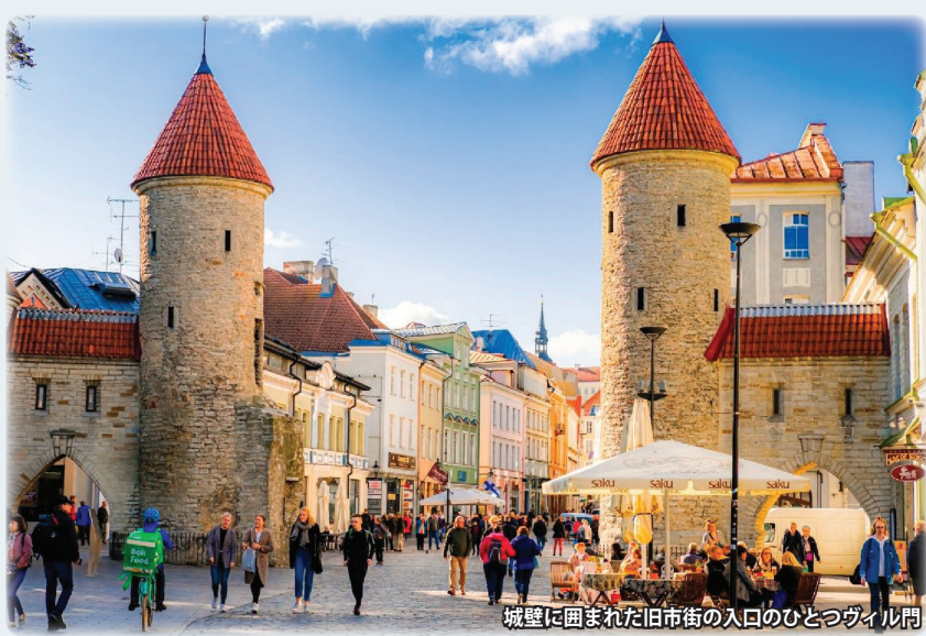
城壁に囲まれた旧市街の入口のひとつヴィル門