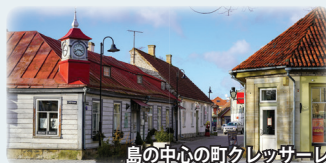
島の中心の町クレッサレ

エストニア最大の島がサーレマー島。ソ連時代は西側との国境の島として立ち入り厳しく制限されていました。そのため、豊かな自然、独自の文化・伝統が息づきます。それ故、「ヨーロッパの原風景」が見られる島と言われます。