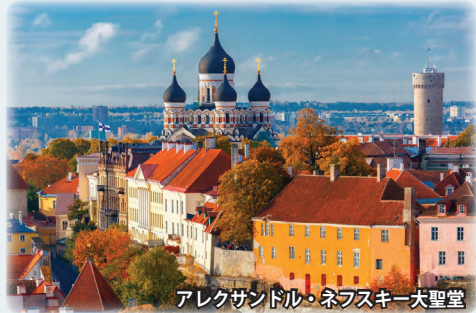
アレクサンドル・ネフスキー大聖堂