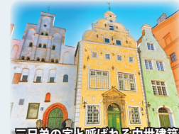
三兄弟の家と呼ばれる中世建築

ゴシック様式の優雅な建築物が並ぶことから、「バルトのパリ」と称されます。一方、新市街にはアールヌーボー様式(ユエグントシュティール)の建築物も見ることが出来ます。