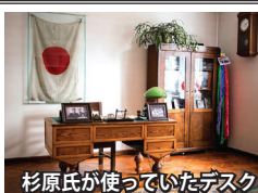
杉原氏が使っていたデスク