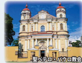
聖ペテロ・パウロ教会

3カ国の首都の中で唯一海に面しておらず、ドイツの影響をあまり受けなかったため、タリンやリーガとは異なり、優美なバロック様式の町並みが特徴です。迷路のように入り組んだ旧市街はヨーロッパ最大級です。