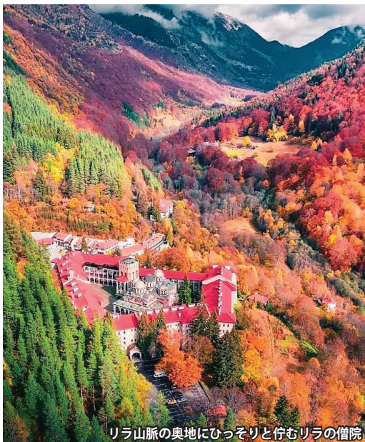
リラ山脈の奥地にひっそりと佇むリラの僧院