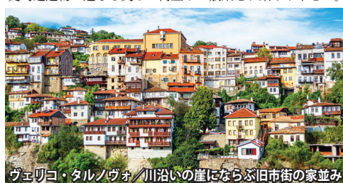
ヴェレツコ・タルノヴォ、川沿いの崖にならぶ旧市街の家並み

古代都市ネセバル 紀元前千年には、既にトラキア人が居住していた黒海の古代都市。細い道で本土と繋がるこの島は、その立地から交易の拠点として栄えてきた。歴史的建造物の連なる美しい街並みの散策をお楽しみ下さい。