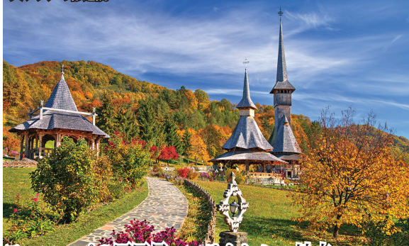
ブルサナの修道院

ヨーロッパの原風景・マラムレシュ地方 ルーマニア・ゴシックとも呼ばれる高い尖塔を持つ木造りの教会が村の中心に聳えています。昔ながらの生活や文化を守り続ける人々の暮らしが今も色濃く残り、さながら民族博物館のようです。