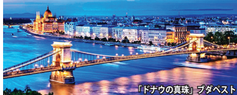
「ドナウの真珠」ブダペスト

「ドナウの真珠」ブダペスト、古都ショブロンなどの美しい街々に加え、中欧最大のバラトン湖周辺、ハンガリー大平原(プスタ)などの見所も訪問します。