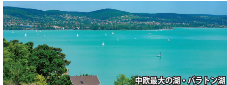
中欧最大の湖・バラトン湖