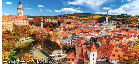
チェスキー・クルムロフ

中世がそのまま残る重厚な建築物・街並みを満喫。世界で最も美しい町のひとつチェスキー・クルムロフでは旧市街に2連泊しますので、朝夕の散策もお楽しみ下さい。また、ヴァルチツェ城、テルチ、ホラショヴィツェ村など珠玉の世界遺産の数々にもご案内します。