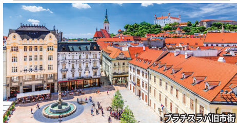
ブラチスラバ旧市街