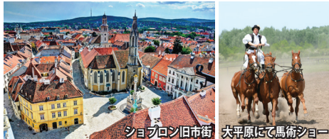
ショブロン旧市街 大平原にて馬術ショー