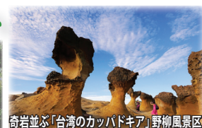
奇岩並ぶ「台湾のカッパドキア」野柳風景区

太魯閣溪谷 エメラルドグリーンに輝く渓流が大理石の岩盤を浸食して形作られた台湾随一の絶景地です。