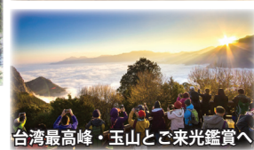
台湾最高峰・玉山とご来光鑑賞へ