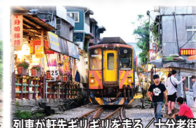
列車が軒先ギリギリを走る/十分老街

竹崎駅～奮起湖駅間を運行する阿里山森林鉄道。標高差が1,000m以上あり、異なる植生から変化に富んだ風景が楽しめます。その他、南国情緒溢れる車窓風景が魅力の集集線、基隆河沿いの山間部を走る平溪線など旅情溢れるローカル線の旅をお楽しみいただけます。